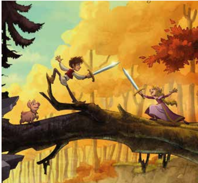
Ritter Trenk op Platt

die Kultusministerkonferenz der Länder hat mit ihren wegweisenden Beschlüssen zur „Medienbildung in der Schule“ und zuletzt zur „Bildung in der digitalen Welt“ beschrieben, wie eine zeitgemäße schulische Bildung mit und über Medien geschehen kann. Zugänge zur kulturellen Bildung in der digitalen Welt eröffnet hier nicht zuletzt das Medium Film – insbesondere, wenn es Kindern und Jugendlichen wie bei den SchulKinoWochen am Ursprungsort der bewegten Bilder begegnet. Gerade weil auch in den neuen sozialen Medien das bewegte Bild allgegenwärtig ist, bietet das „hergebrachte“ kulturelle Medium des Kinofilms Schüler*innen wie Lehrkräften einen schier unerschöpflichen Fundus an Möglichkeiten, um analysierende, reflektierende und kommunikative Medienkompetenzen, die von der KMK-Digitalbildungsstrategie jetzt und in Zukunft gefordert sind, zu erwerben.