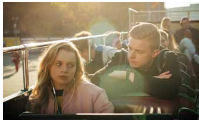
Das schönste Mädchen der Welt