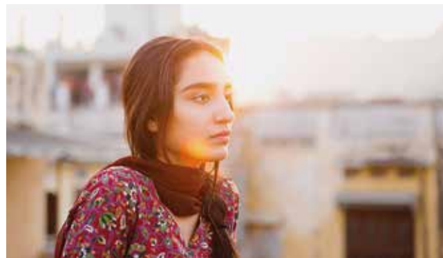
Was werden die Leute sagen